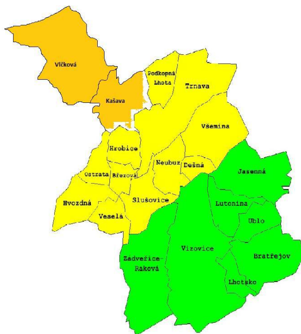
Mapa MAS VaS k 30. 6. 2011