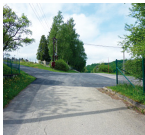
Obnovená komunikace v obci Ublo