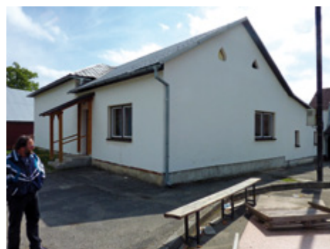
Lutonina provedla rozsáhlé stavební úpravy v Kulturním domě