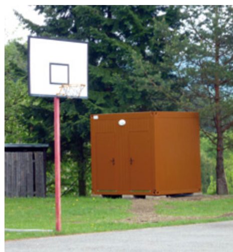
Nové sociální zařízení ve volnočasovém areálu v obci Ublo