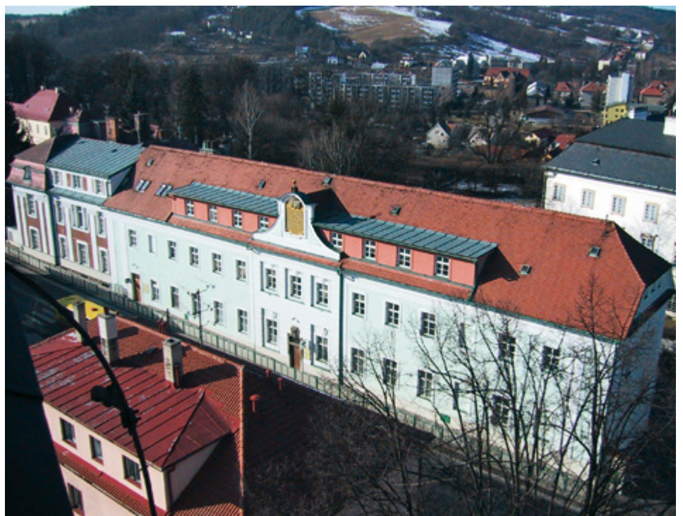
Nemocnice Milosrdných bratří je v tyto dny pod lešením, realizujeme zde jeden z projektů MAS

Poskytovat všem pacientům odbornou léčebnou a ošetrovatelskou péči, ale v duchu zakladatele řádu sv. Jana z Boha vnímat a uspokojovat též duševní a duchovní potřeby našich pacientů, aby odcházeli „poléčení na duchu i na těle“, jak se s vědeckostí mnozí pacienti s námi loučí. Mnozí lékaři i příbuzní našich pacientů se na nás obracují s důvěrou, že celkovou mobilizací a zvláště rehabilitací v rámci