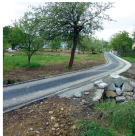
Nová komunikace na Chrámečném je těsně před dokončením