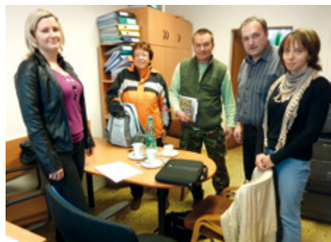
Setkání jedné z pracovních skupin

Program LEADER klade důraz na zapojení a spolupráci místních aktérů, protože jedině ti dobře znají slabé a silné stránky dané oblasti. Na Vizovicko a Slušovicko to byli zvláště představitelé obou mikroregionů, kteří vzali tuto myšlenku za svou a přivedli k ní některé další členy z oblasti neziskovek, podnikání a zemědělství. Jeho cílem je motivovat a podporovat místní subjekty tak, aby uvažovaly o dlouhodobých perspektivách svého regionu. K nejdůležitějším prvkům programu patří