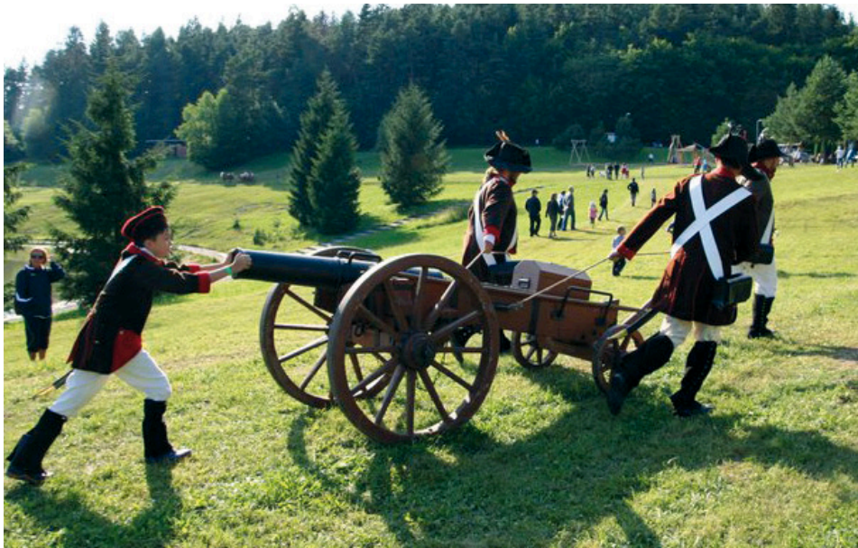
Vzpomínka na loňský dětský den

Velkou předzvěstí letošních prázdnin bude v sobotu 30. června 2012 areál Activityparku Hotel Všemina.